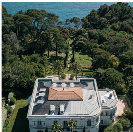
*Domaine de Rocabella

“Par l'adoption d'un corail, les personnes se sentent investies dans la préservation de la biodiversité marine. L'immersion proposée lors des weekends Vaïba donne envie d'agir et de protéger”, explique Virginia Dausque.